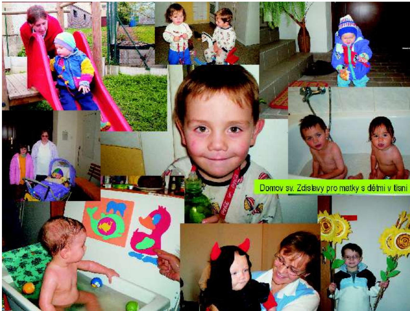
Domov sv. Zdislavy pro matky s dětmi v tísni