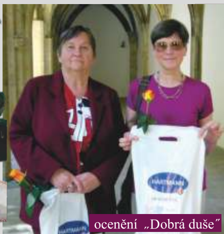
ocenění „Dobrá duše“